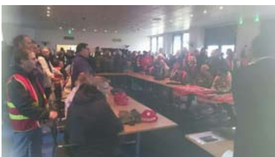
Importantes délégations à Direction Régionale de Normandie EDG et ENGIE

L'entrevue s'est terminée par la mise en route de l'alarme. Encore un coup de la direction qui était en difficulté.