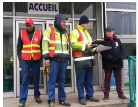
Greif : La CGT ne lâche rien !

A plusieurs reprises la CGT a invité les salariés au débat concernant les propositions de leur direction pour les NAO 2017. Au regard des contre propositions loin d'être au niveau de leurs attentes, la cinquantaine de salariés présents en AG ont refusé d'accepter les propositions de la direction, la lutte continue.