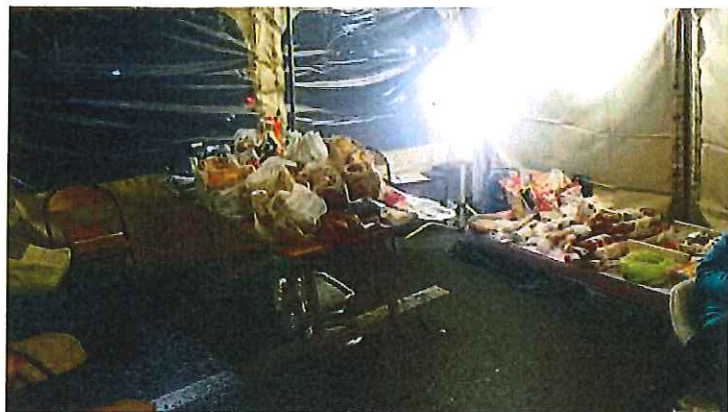
Soutien de la population et des commerçants