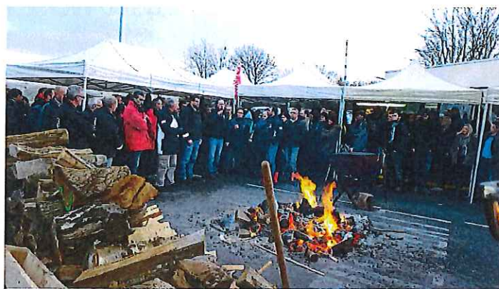
Grève reconduite ce jour à 16h